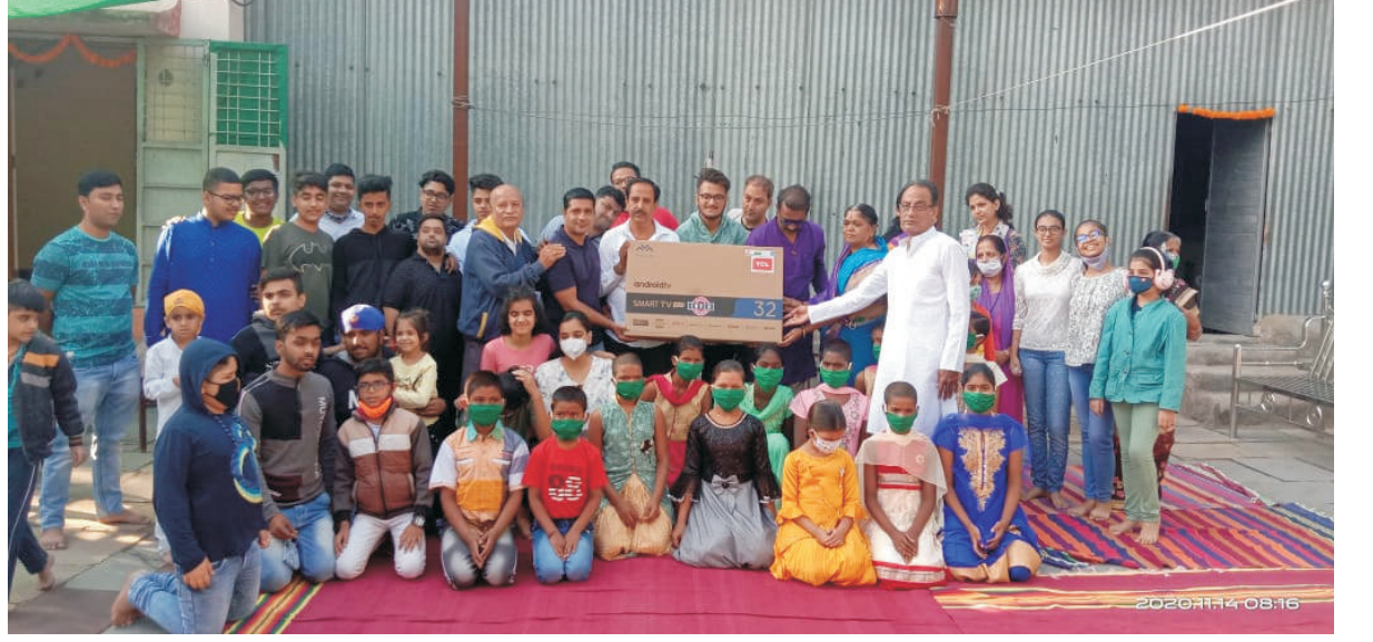
सेवा संस्था व योग वेदांत सेवा समितीने अविश्री बाल सद्नातील विद्यार्थ्यांबरोबर दिवाळी व बालदिन साजरा केला

दोंड(सहकारनामा प्रतिनिधी): आपल्या घरातील मुलांप्रमाणेच बाल सद्नातील मुलांची सुध्दा दिवाळी गोड व आनंदात साजरी व्हावी या उद्देशाने येथील वाहेगुरु सेवा संस्था व योग वेदांत सेवा समितीने कुरकुंभ(ता.दोंड) येथील अविश्री बाल सद्नातील विद्यार्थ्यांबरोबर दिवाळी व बालदिन उत्साहात साजरा