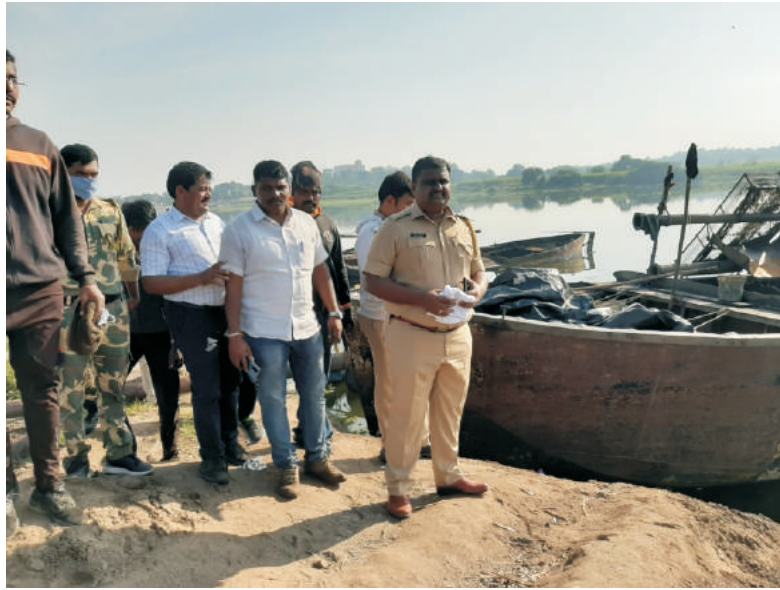
९ फायबर व ८ सेक्शन बोटी जिलेटिनच्या साह्याने उध्वस्त करण्यात आल्या