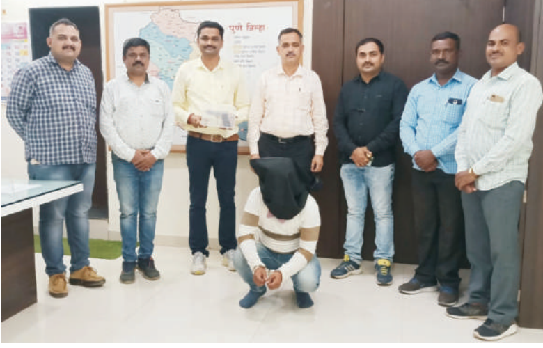
एलसीबी टीम कारवाईनंतर आरोपीसह एलसीबी पथकासह

एलसीबी टीमने ज्यावेळी त्याची झडती घेतली त्यावेळी त्याकडे एक